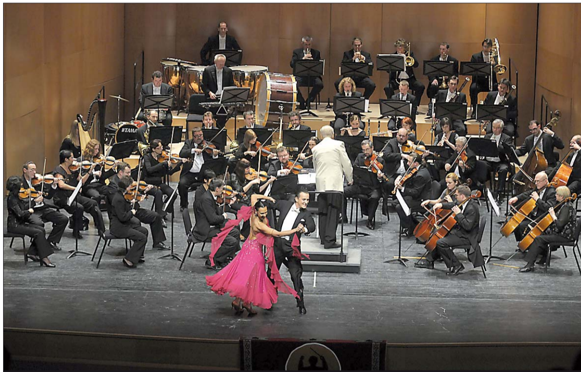
La sorpresa fue la actuación de una pareja de baile al final del concierto.

Hemos llegado al punto de que dirigir este concierto en Viena es