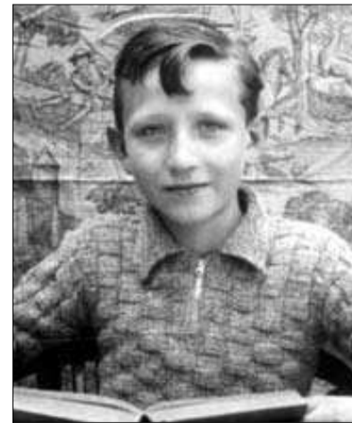
Fotografía de su Primera Comunción, en 1932, y la típica foto de estudiante, en los Maristas de Alcoy, en 1933.