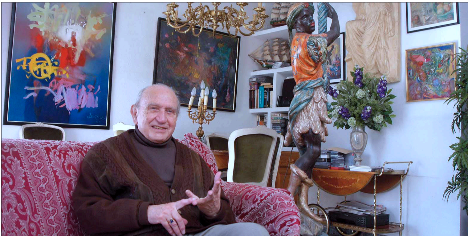
El escritor e investigador en una foto de archivo en su vivienda en Alcoy, a donde regresó en 1988 después de 32 años viviendo en París.

LA JUNTA DE PORTAVOCES MUNICIPALES TOMA EL ACUERDO DEL RECONOCIMIENTO / Págs. 10 y 11