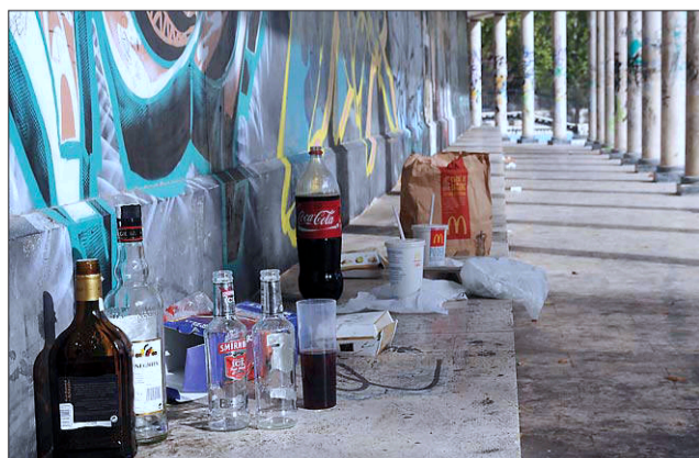
Restos del botellón, ayer por la mañana, en el parque de El Romeral.

Los han calificado de 'macrobotellones' dada la cantidad de estudiantes que se concentraron en El Romeral y el cauce del río en la noche de 'los borregos', con protestas vecinales, siendo disueltos por la policía.