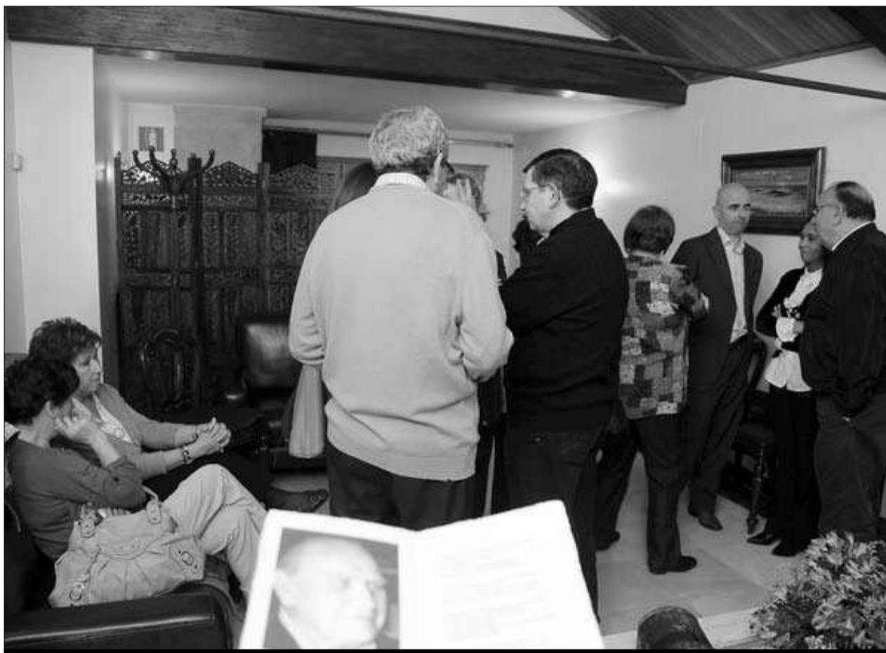
La capilla ardiente está en el Tanatori d'Alcoi de la calle San Vicente.

LA CIUDAD LAMENTA LA MUERTE DEL HIJO PREDILECTO DE ALCOY